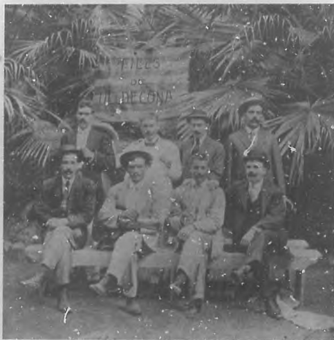
La Directiva de la nueva sociedad. Hijos de Uldecona, recientemente constituida. Fotografía hecha en los Jardines de "La Tropical" después del almuerzo íntimo con que los socios de aquella agrupación celebraron la constitución de la misma, sabiendo lo que puede llamarse tradición en sociedades recreativas, pues todas acuden á los bellos jardines á solemnizar su "maclimiento". Larga vida deseamos á la sociedad Hijos de Uldecona.

Y si vistiendo y cantando fué grande el aspecto, no fué menos interpretando y sintiendo el personaje al que dió vida con el mayor cariño expresando con la acción y el gesto los diversos estados por que pasa el alma de la joven ora picaresca, ora ruborosa pero siempre sencilla que tal ha de ser Rosina.