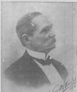
† DON TOMÁS ESTRADA PALMA

He aquí un libro que trae una noble finalidad que cumplir. En sus páginas iniciales se lee: "Destinado el producto neto de la edición al acrecimiento de los fondos para erigir a Estrada Palma una estatua en la Habana".