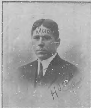
SR. CARLOS DE VELASCO

Después puede descansar, satisfecho de su labor. La reverencia de nuestro pueblo por el que fué nuestro primer Presidente, vendrá más tarde. Cuando ante su estatua se establezca mentalmente un paralelo entre su conducta y la de los que le precedieron. . . .— Ramón Ruiz López.