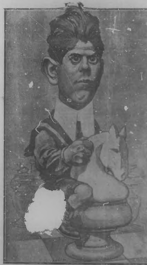
José Raul Capablanca, organizador por iniciativa propia, de la "Ofrenda á Capablanca" en el Frontón.

Resultado de mucho éxito el partido de ajedrez animado, ó vivo, y, después de veinte y nueve jugadas el señor Corzo sufrió una humosa y esperada derrota.