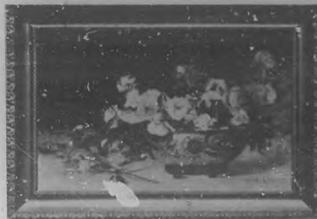
Flores.—Por Elvira M. Vda. de Molero.